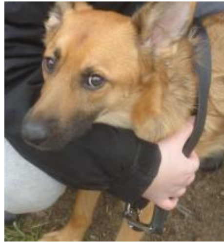
Tima in PS in 64546 Mörfelden-Walldorf