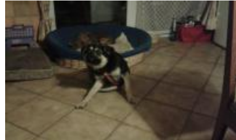
Simon in PS 01968 Großkoschen