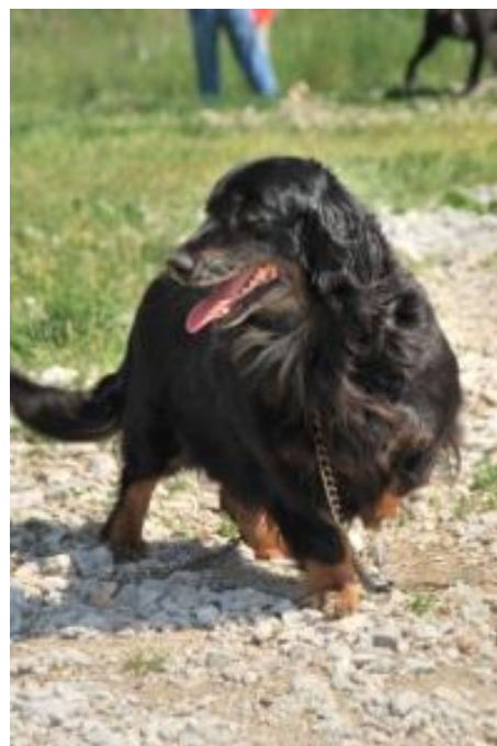
Picur in einer Pflegestelle Köln