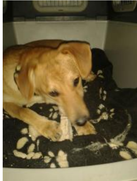
Chilly in einer Pflegestelle in 57612 Giesenhausen