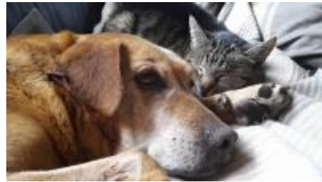
Mitch in einer Pflegestelle (48612 Horstmar- NRW)