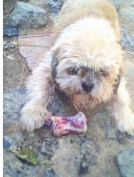
Griffy in Ungarn (im Tierheim)