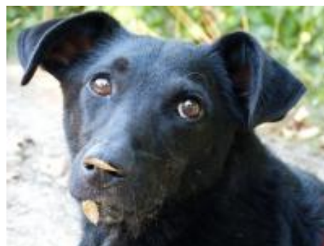
Mafi in 50321 Brühl