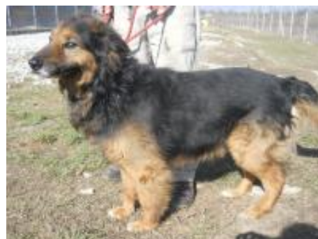
Dusty in PS in Oesterode im Harz