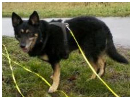
Rocco in 64521 Groß-Gerau in

Rasse: Schäferhund Mischling Name: Rocco (Ramszesz)