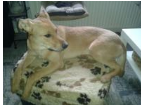
Pepper in einer Pflegestelle in 57612 Giesenhausen