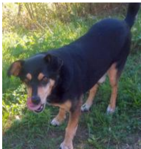
Jimmy in Oberaula in Pflege