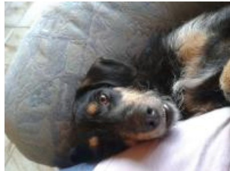
Gitty in PS in 59227 Ahlen