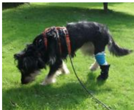
Greta in PS in 29342 Wienhausen /Nähe Celle

Rasse: Mischling Name: Greta (ehemals Szöri)