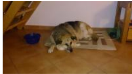
Bruni in einer Pflegestelle in 31832 Springe