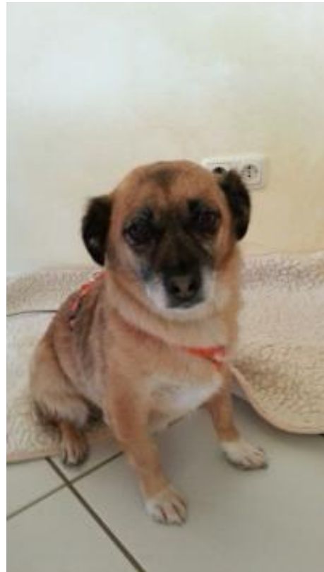
Cuki in einer Pflegestelle in 41238 Mönchengladbach