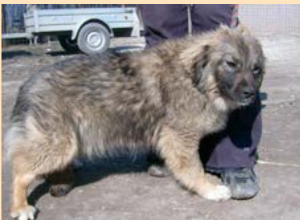
Hilda noch im Tierheim

Wir freuen uns schon sehr auf die Bilder Ihrer einmaligen Hunde und Katzen und bedanken uns schon im Voraus für Ihre Einsendungen!