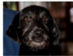
Bogró geboren ca.: 05/2020 Aufenthaltsort: Tierheim Miskolc Welpenstube! Die selbstbewusste Bogró sucht ein Körbchen bei aktiven Menschen! » mehr lesen