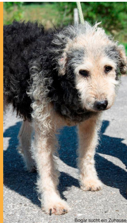
Bogar sucht ein Zuhause