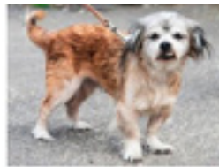
Saci geboren ca.: 01/2010 Aufenthaltsort: Tierheim Miskolc - reist am 18.10. auf eine Pflegestelle in 45731 Waltrop Saci wurde plötzlich auf der Straße gesichtet - alleine, ohne Chip, ohne Menschen. Wo kommt sie wohl her? Jetzt beginnt ihr neues Leben. » mehr lesen