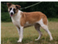
Masni geboren ca.: 11/2018 Aufenthaltsort: Tierheim Miskolc - reist am 18.10. auf eine Pflegestelle in 46485 Wesel Masni kam mit ihrer Schwester Mandi ins Tierheim. Zwei wunderschöne Hündinnen, die keinen guten Start ins Leben hatten. Sie darf gerne bald auf ihrer Pflegestelle besucht und kennengelernt werden. » mehr lesen