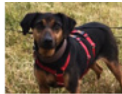
Mirza geboren ca.: 04/2014 Aufenthaltsort: Pflegestelle in 45966 Gladbeck Mirza - ein Herz auf vier Pfoten sucht ihre Herzensmenschen! Sie kann gerne auf ihrer Pflegestelle besucht und kennengelernt werden. » mehr lesen