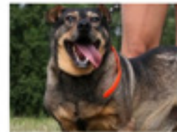
Nando (Tornado, reserviert) geboren ca.: 07/2011 Aufenthaltsort: Tierheim Miskolc - reist am 18.10. nach Deutschland in sein neues Zuhause! Einen neuen Namen, nämlich Nando, hat Tornado schon bekommen - und im Oktober geht es dann ins neue Zuhause!