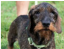
Odin geboren ca.: 09/2005 Aufenthaltsort: Tierheim Miskolc Dackel-Senior Odin wünscht sich eine zweite Chance! » mehr lesen

Wir und viele andere Fellnasen suchen noch nach unserem Für-immer-Zuhause. Wir leben entweder schon auf Pflegestellen, auf denen wir besucht und kennengelernt werden können oder warten noch auf einen Sitzplatz im Transporter. Alle aktuellen Kandidaten finden Sie hier: http://www.canifair.de/de/zuhause-gesucht-hunde/