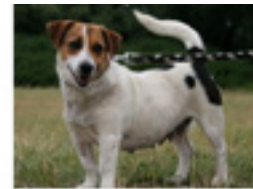
Dina geboren ca.: 05/2017 Aufenthaltsort: Tierheim Miskolc - reist am 18.10. auf eine Pflegestelle in 41061 Mönchengladbach Die kleine Dina wurde alleine auf der Straße gefunden und niemand kannte sie. Wer schenkt ihr eine zweite Chance? Sie kann gerne bald auf ihrer Pflegestelle besucht und kennengelernt werden. » mehr lesen