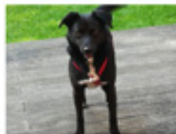
Koni geboren ca.: 06/2015 Aufenthaltsort: Pflegestelle 41238 Mönchengladbach Süßer Koni mit den wunderschönen Augen bricht die Herzen aller Frauen! Seit dem 19.7. lebt Koni auf einer Pflegestelle in 41238 Mönchengladbach! » mehr lesen