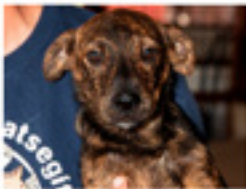
Jenő geboren ca.: 05/2020 Aufenthaltsort: Tierheim Miskolc Welpenstube - der süße Jenő sucht ein passendes Körbchen! » mehr lesen