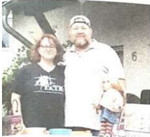
„Jeenreich: dieser teilnehmende Haushalt trödelte für den Tierschutz

mehr liest, Tonfigürchen, d Regal vor sich hin stauben, dung, die nicht mehr passt - hat solche Dinge zuhause li die er nicht mehr braucht die nicht mehr gefallen. Schränke, Regale, Dachboden Keller sind vollgestopft davor man hat kaum noch Platz für wirklich wichtigen Dinge. H te Zeit, den alten Kram losz den - am besten natürlich g Bares, damit man sich davon