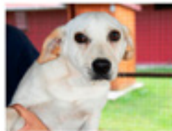
Csillag geboren ca.: 01/2020 Aufenthaltsort: Tierheim Miskolc Teenie-Hündin Csillag hat keinen tollen Start ins Leben - wer hat ein Körbchen frei für die süße Maus? » mehr lesen