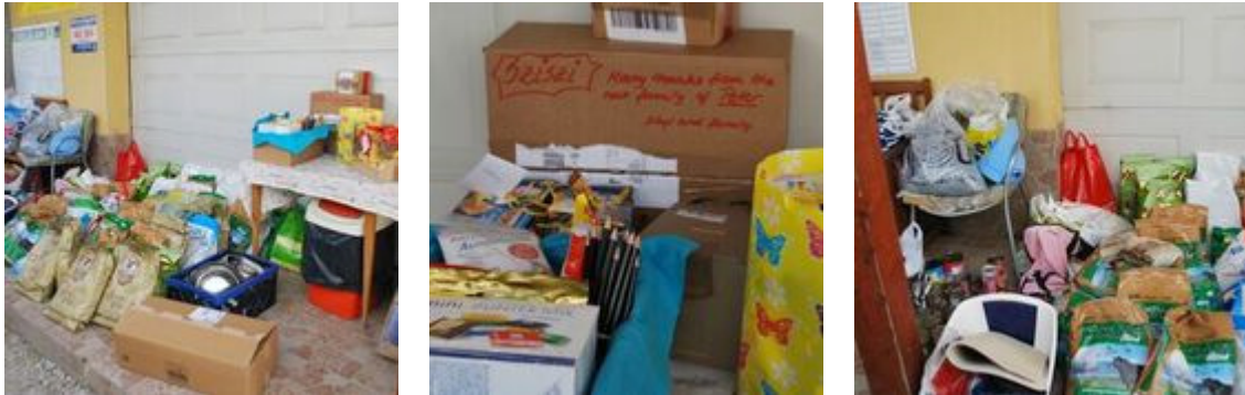
Spenden, Spenden und Geschenke ... :)

die Mitarbeiter des Tierheims – es ist so schön, in die strahlenden Gesichter zu blicken, die mir mittlerweile schon so vertraut und lieb geworden sind.