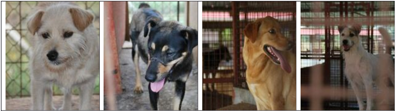
Sie alle warten auf ein Zuhause ...