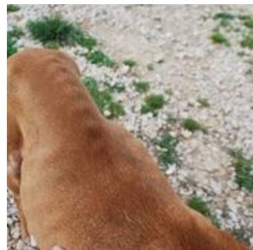
Meine kleine „Zaubermaus“ ... Bilder von Mai, als ich sie das erste Mal gesehen habe

Sie hat gerade Futter bekommen und steht mit dem Rücken zu uns über dem Futternapf geneigt. Und knurrt und fletscht und fletscht und knurrt – gegen den Hund im Nachbarzwinger, den sie nicht sehen kann, aber den sie in diesem Moment wohl am liebsten fressen würde.